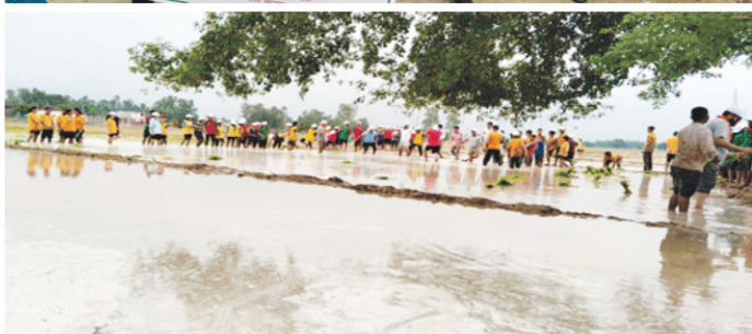
कृषक अवलोकन भ्रमण