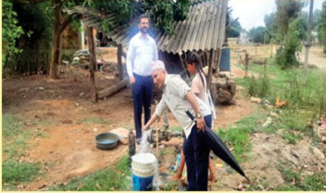
सिचाई सहित कृषि विकास कार्यक्रम