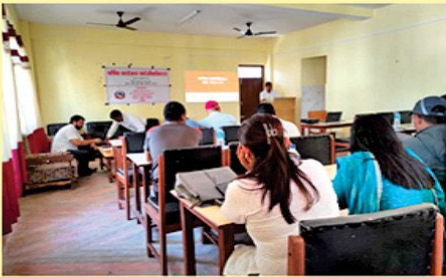
वार्षिक कार्यक्रम सार्वजनिकरण २०८०