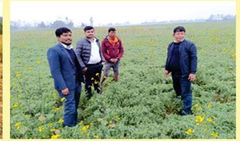
तुला सिचाई आयोजनाहरूको कमाण्ड क्षेत्रमा बाली सघनता वृद्धि कार्यक्रमको मसुरो बालीको अवलोकन