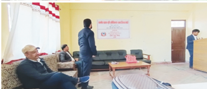
जिल्ला स्तरीय अगुवा कृषक तालिम