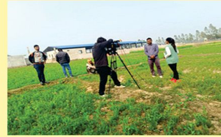
बाली बस्तु विशेष सघन न्यावसाय उत्पादन क्षेत्र विकास कार्यक्रमबाट वितरित मसुरो बालीको खेती सम्बन्धी NTV बाँकेबाट भिडियो डकुमेन्ट्री तयार गरिदै