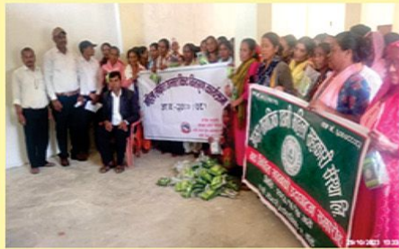
महिला लक्षित तरकारी किट बितरण