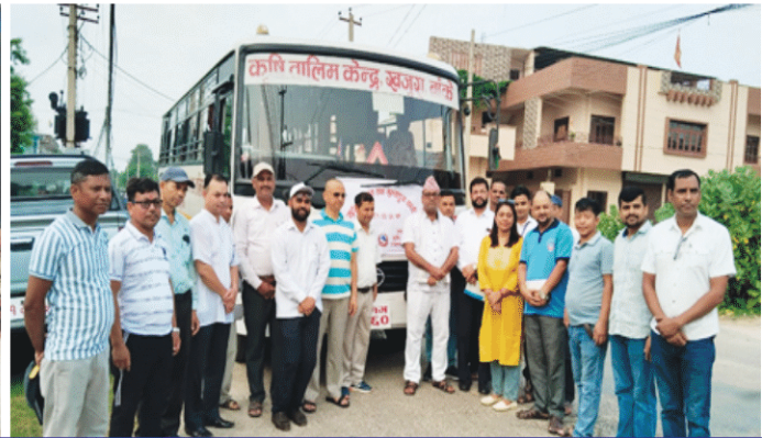
संयुक्त अनुगमन तथा मूल्यांकन