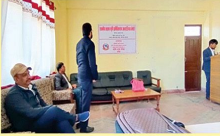
जिल्लास्तरीय अगुवा कृषक तालिम