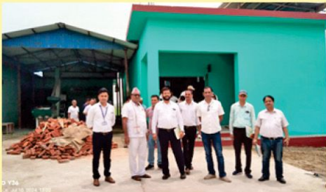
बीउ गोदामघर निर्माण