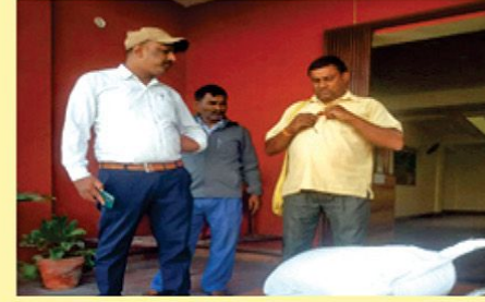
मुसुरो बिउ बितरण