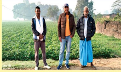
पि.वि.एस. आलु बीउ वितरण कार्यक्रम