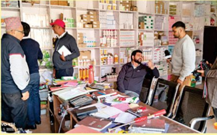
बीउ, मल तथा विषादी अनुगमन