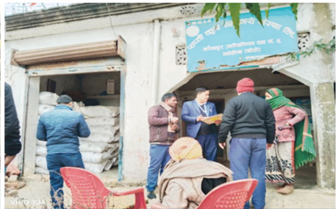
मल, बीज तथा विषादी अनुगमन