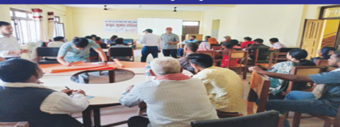
स्थानीय तह कृषि प्राविधिसंग अन्तरक्रिया गोष्ठी