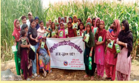
महिला लक्षित मिनीकीट वितरण कार्यक्रम