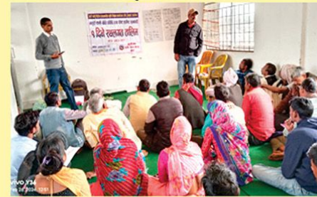
बाली बस्तु विशेष सघन न्यावसायिक उत्पादन क्षेत्र विकास कार्यक्रम अन्तर्गत स्थलगत तालिम