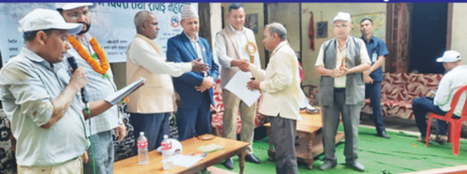
कृषक सम्मान कार्यक्रम