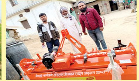
बीज वृद्धि कार्यक्रम