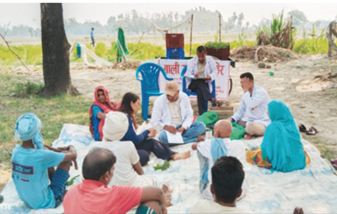
बाली उपचार शिविर