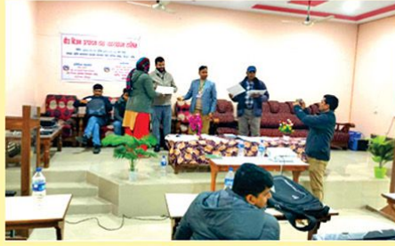
स्थानीय तहका कृषि प्राविधिकसंग अन्तरक्रिया गोष्ठी