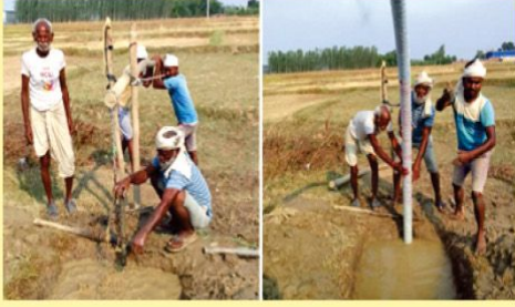
सिचाई सहित कृषि विकास कार्यक्रम