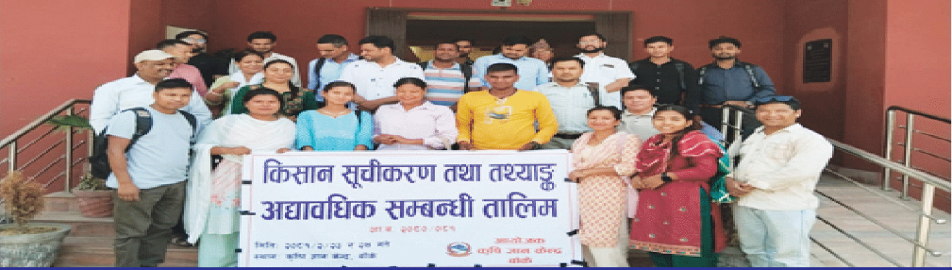
स्थानीय तहका कर्मचारीहरुलाई किसान सूचीकरण तथा तथ्यांक अद्यावधिक सम्बन्धी तालिम