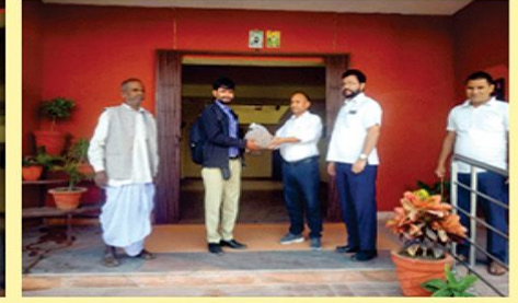
पि.वि.एस. बीउ आलु दान बितरण